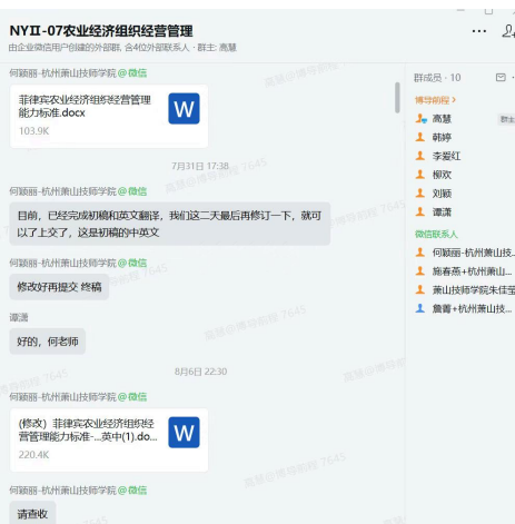
项目秘书处组建标准开发工作群与中方院校协同推进项目实施