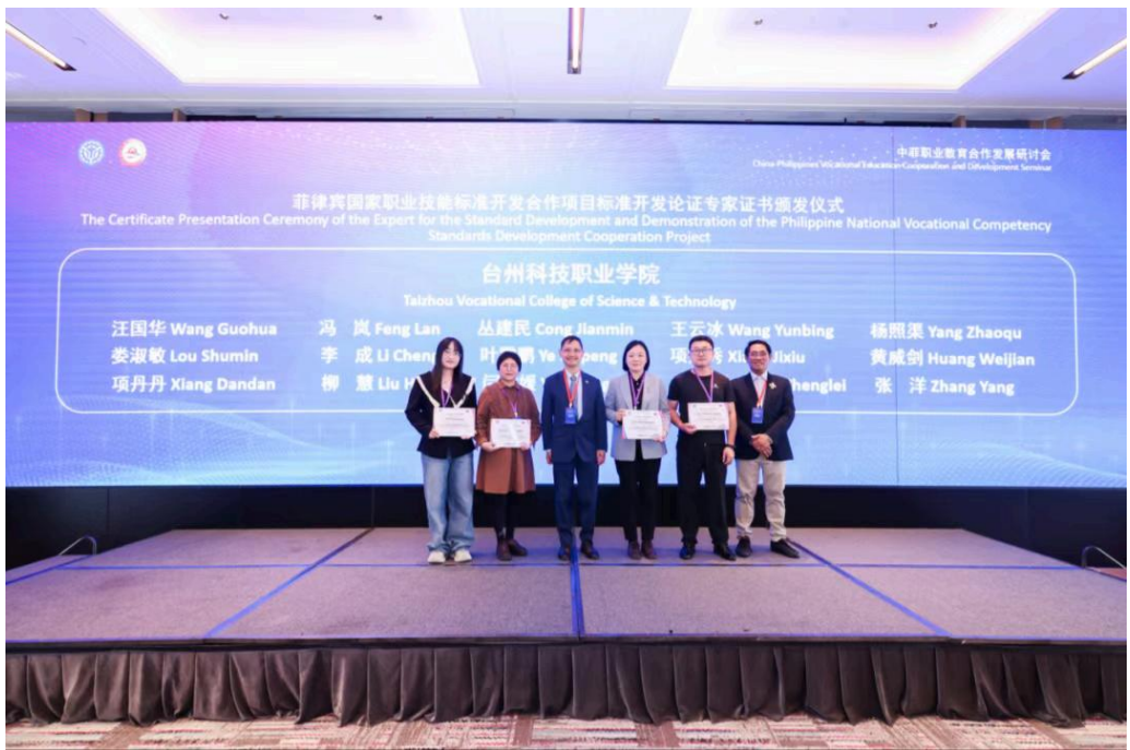
TESDA署长贝尼特斯为参与二期标准开发的专家颁发认证证书