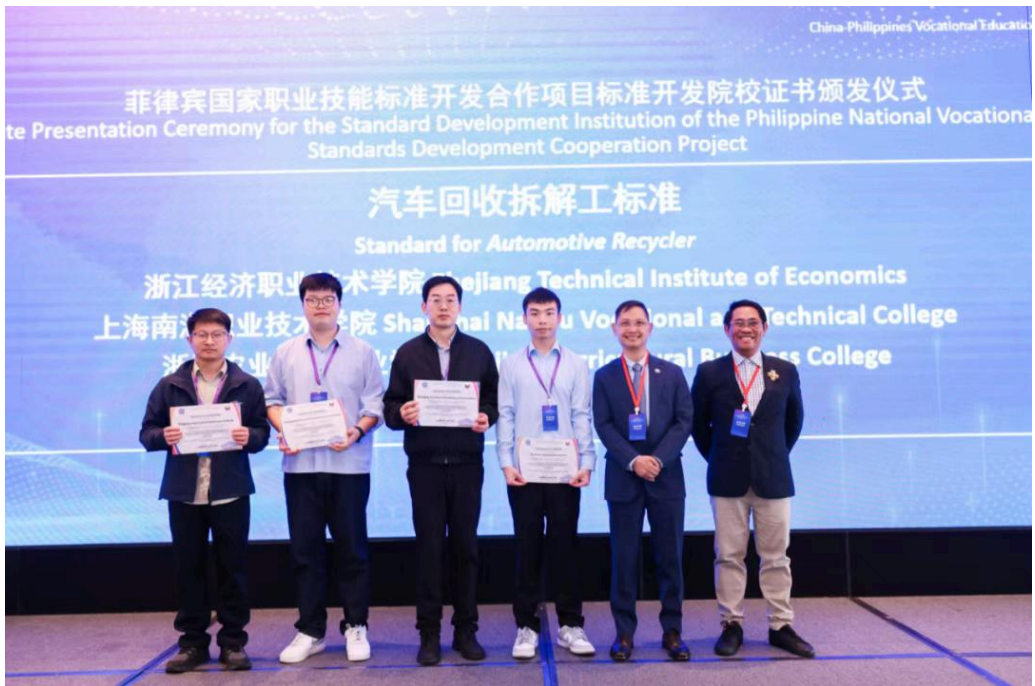
TESDA署长贝尼特斯为参与二期标准开发的院校颁发认证证书