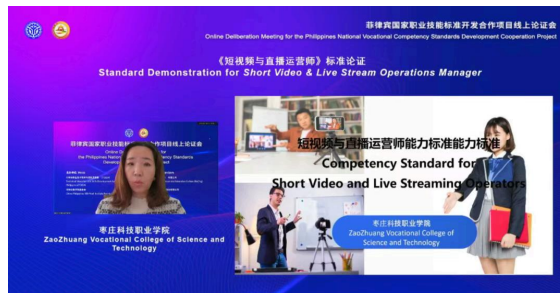
中方标准开发院校与TESDA就标准草案进行线上论证